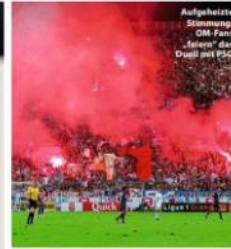
Aufgeheizte Stimmung: OM-Fans feiern das Duell mit PSG

Fünf explosive FUSSBALL KNALLER an einem Tag