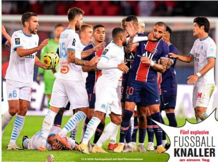
13.9.2020: Nachspielzeit mit fünf Platzverweisen