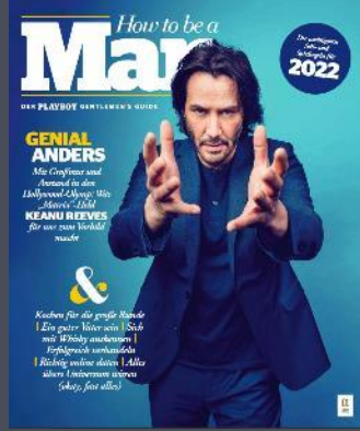
HOW TO BE A MAN Once annually