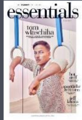
PLAYBOY ESSENTIALS 2x annually