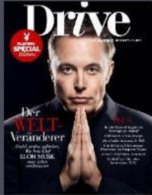
DRIVE Once annually